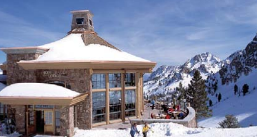
スノーベースンのジョンボールロッジ