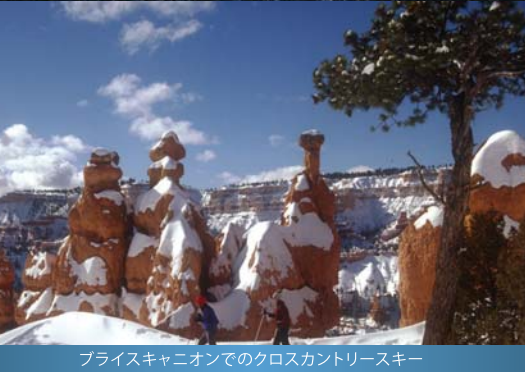
ブライスカニオンでのクロスカントリースキー