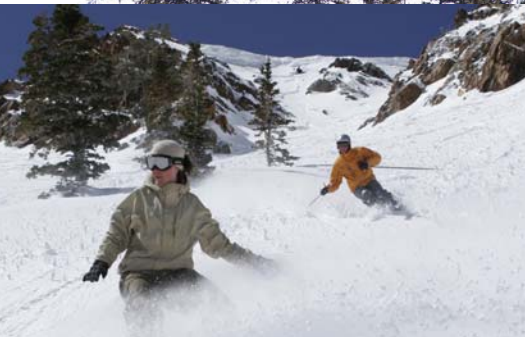
パークシティで楽しむスキーヤー