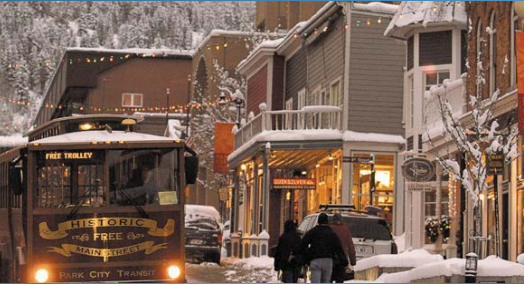
キャニオンランス国立公園、