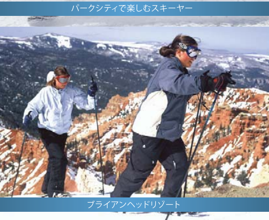
ブライアンヘッドリゾート