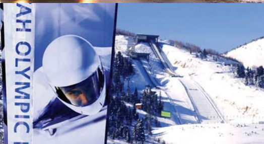
ユタ・オリンピックパーク(パークシティ)