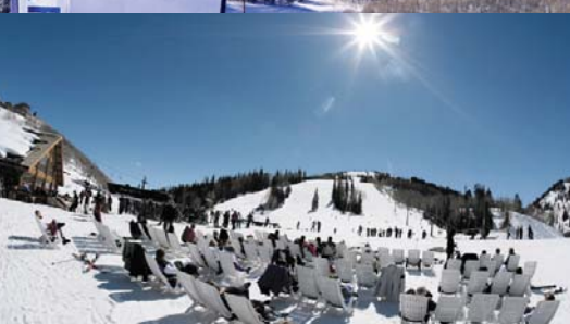
ディアバレーリゾート