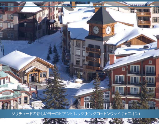
ソリチュードの新しいヨーロッパビレッジ(ビッグコットンウッドキャニオン)