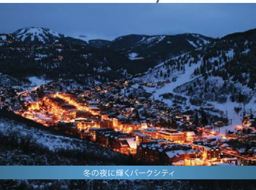
冬の夜に輝くパークシティ